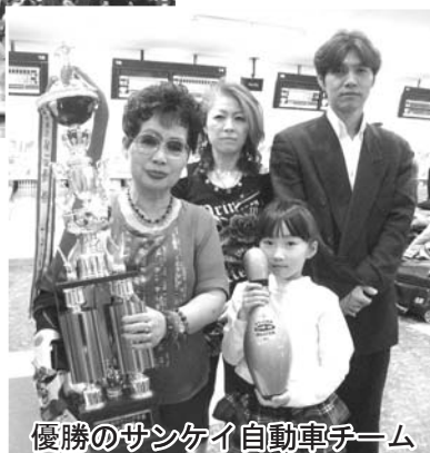
優勝のサンケイ自動車チーム