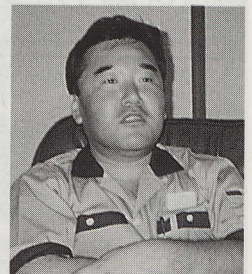
人材を人財に育てる。社長の目標は、人材を人財に育てる。社長の目標は、人材を人財に育てる。

・もっと、性能を上げて他社製品と差をつけたい ・もっと、軽量化・小型化した ・もっと、コストを下げたい ・もっと、クレームを減らしたい ・もっと、安定供給を受けたい 等モア・アンド・モアの技術改善、社風を醸