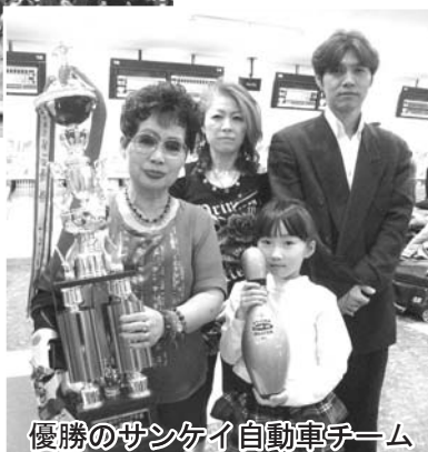
優勝のサンケイ自動車チーム