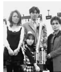
優勝のサンケイ自動車チーム